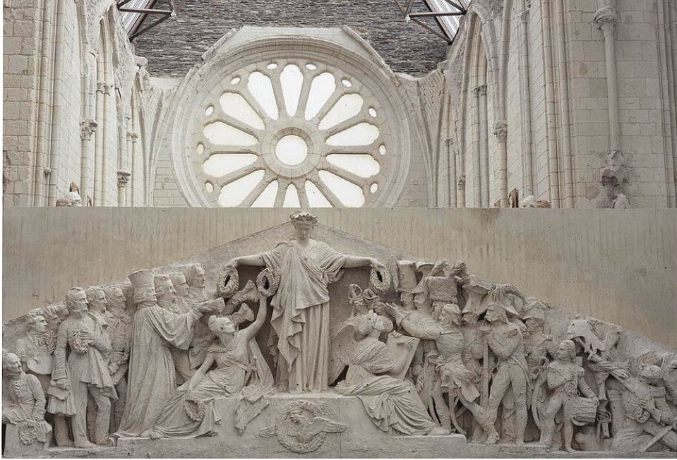
FRONTON DU PANTHÉON