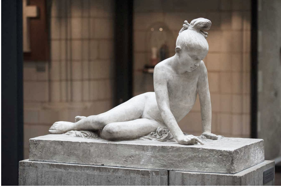
LA JEUNE GRECQUE