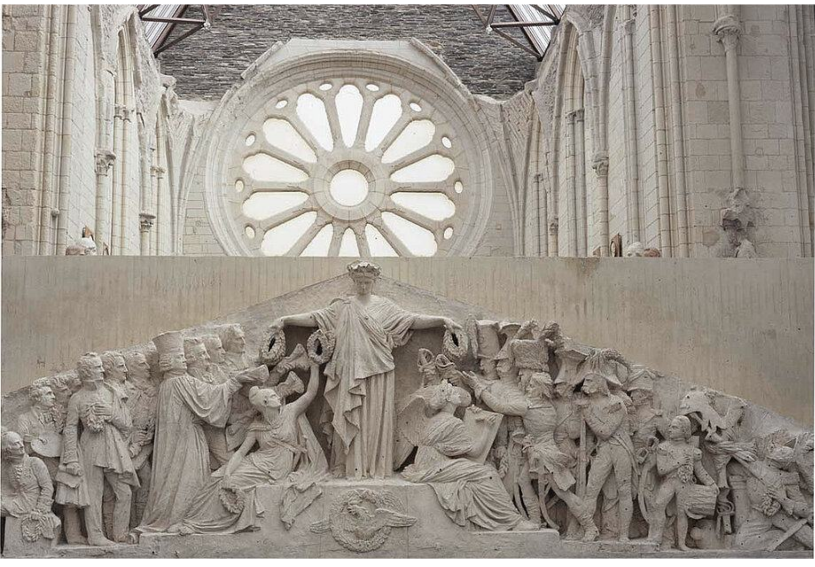
FRONTON DU PANTHÉON