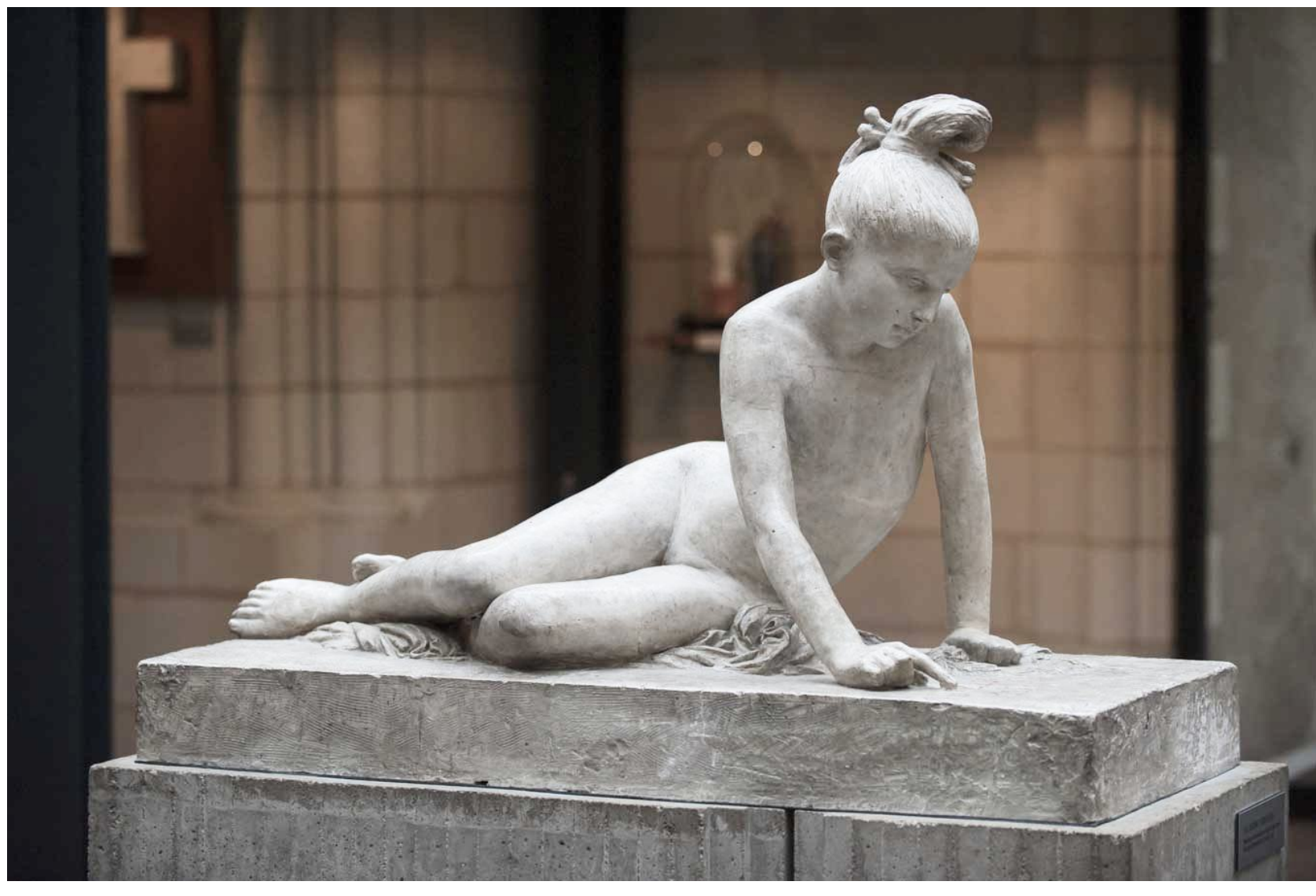
LA JEUNE GRECQUE